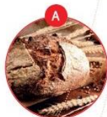
A GLUTENHALTIGES GETREIDE UND DARAUS GEWONNENE ERZEUGNISSE