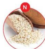
N SESAMSAMEN UND DARAUS GEWONNENE ERZEUGNISSE