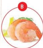
B KREBSTIERE- UND DARAUS GEWONNENE ERZEUGNISSE