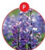
P LUPINEN UND DARAUS GEWONNENE ERZEUGNISSE