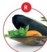
R WEICHTIERE WIE SCHNECKEN, MUSCHELN, TINTENFISCHE UND DARAUS GEWONNENE ERZEUGNISSE