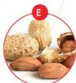
E ERDNÜSSE UND DARAUS GEWONNENE ERZEUGNISSE