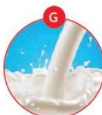
G MILCH VON SÄUGETIEREN UND MILCHERZEUGNISSE (INKLUSIVE LAKTOSE)