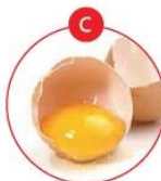
C EIERVON, GEFLÜGEL UND DARAUS GEWONNENE ERZEUGNISSE