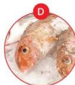
D FISCH UND DARAUS GEWONNENE ERZEUGNISSE (AUSSER FISCHGELATINE)