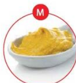
M SENF UND DARAUS GEWONNENE ERZEUGNISSE