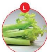
L SELLERIE UND DARAUS GEWONNENE ERZEUGNISSE