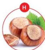
H SCHALENFRÜCHTE UND DARAUS GEWONNENE ERZEUGNISSE