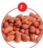
F SOJABOHNEN UND DARAUS GEWONNENE ERZEUGNISSE