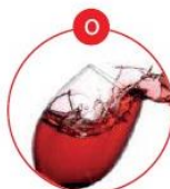
O SCHWEFELDIOXID UND SULFITE